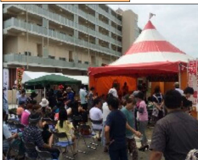
↑ 去年の夏まつりの様子